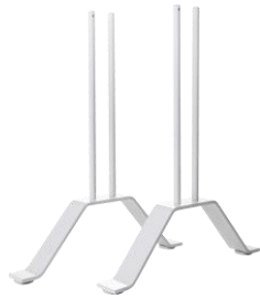
Zubehör: Standfüße VZ-VF-SF