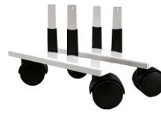
Zubehör: Laufrollen VZ-VF-LR