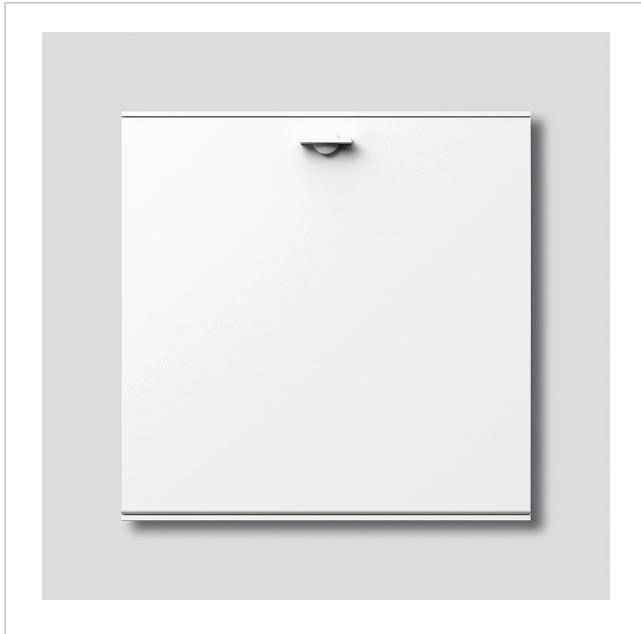
Ablagefach-Modul AFM 611-4/4-0 W