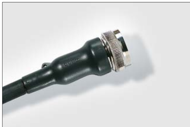
155-42-G auf einen Rundstecker geschrumpft.

Weitere Informationen zu Material und Klebstoff auf Seite 274 und 275.