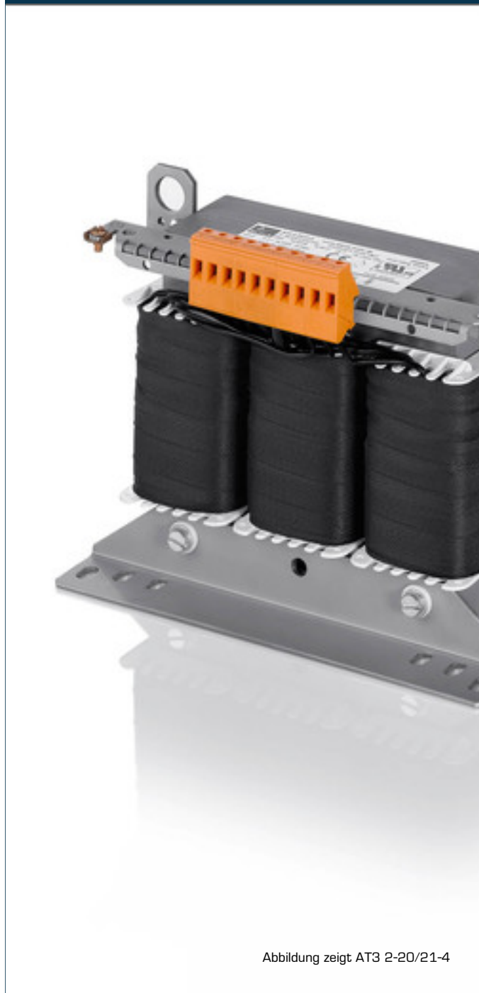
Abbildung zeigt AT3 2-20/21-4