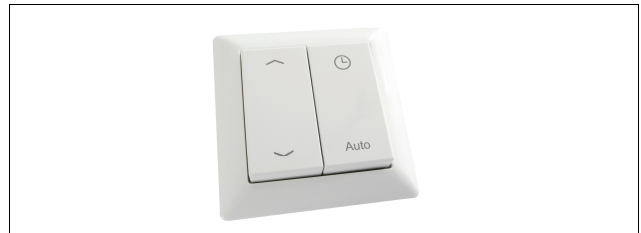
Abb. 2.1 Lieferumfang