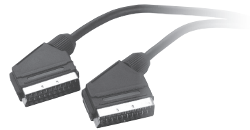
▲ SC1521L (X4358)