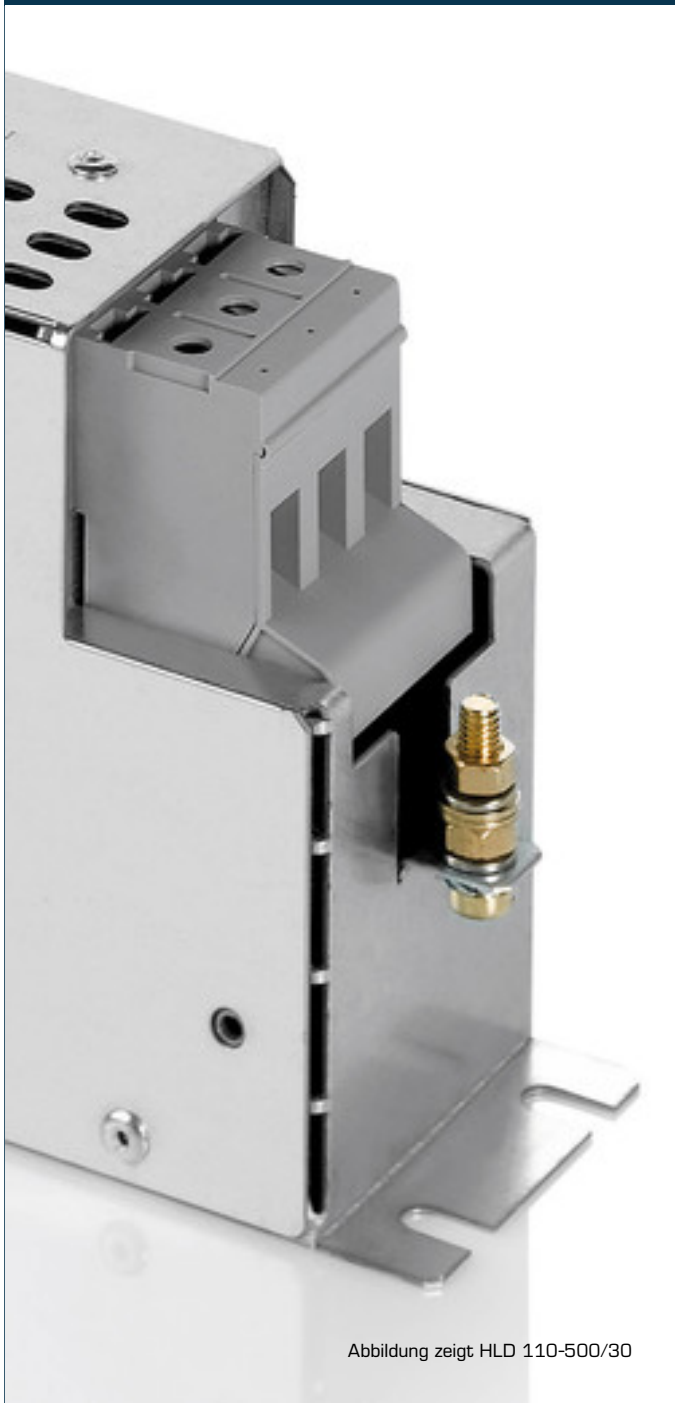
Abbildung zeigt HLD 110-500/30