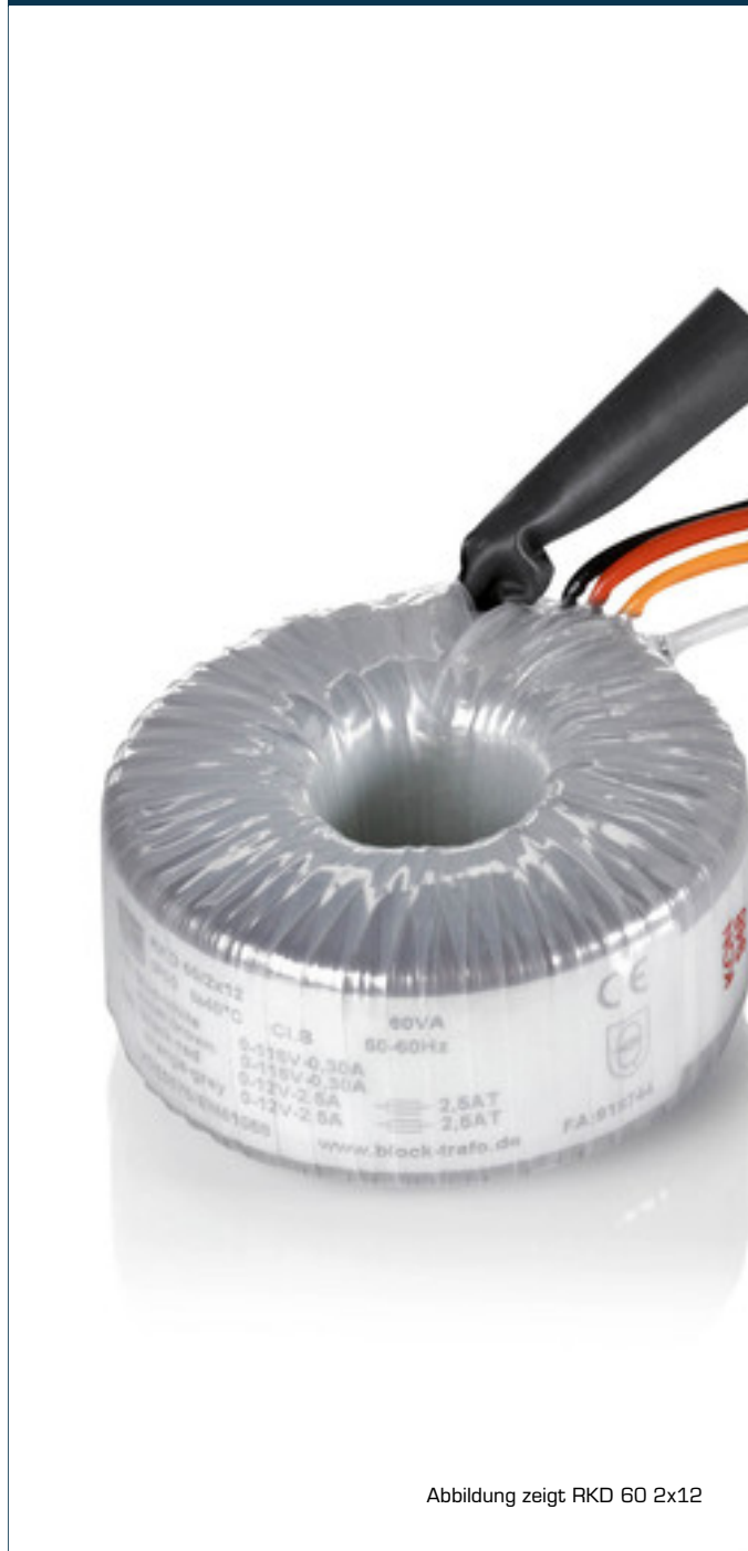
Abbildung zeigt RKD 60 2x12